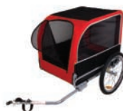
Husky für Hunde