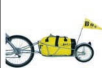
Bob Yak Transport